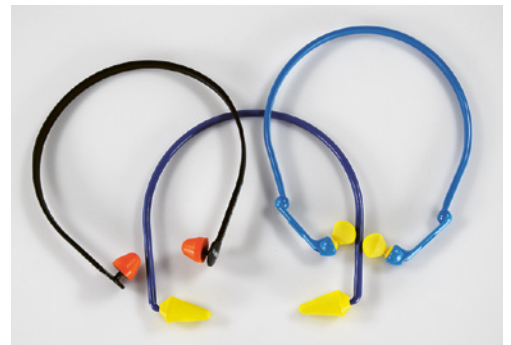
3 Gehörschutzbügel (nur bis max. 90dB(A) und max. für 1 Std. pro Tag geeignet).