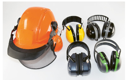
4 Gehörschutzkapseln in verschiedenen Ausführungen.

Beschädigte und spröde Dichtkissen sowie schmutzige Schaumstoffeinlagen können separat ersetzt werden.