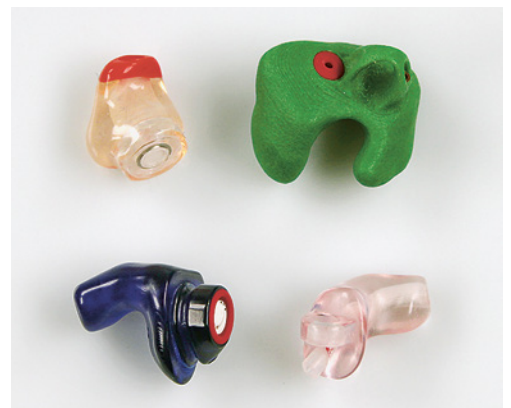
5 Otoplasten werden individuell angepasst und haben eine feste Form.

Weitere Informationen zum Thema Lärm finden Sie unter www.suva.ch/laerm